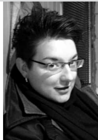
piše: Olga Dimitrijević

Jasno je da su se komični aspekti i humor koji je sveprisutan kod Čehova trebali smenjivati sa dubokom emotivnom patnjom, i da je to trebalo da nas emotivno uzbudi i pročisti, ali toga, sinoć, prosto nije bilo. I na kraju smo umesto svevremenske duboko potresne priče, odmaknute od