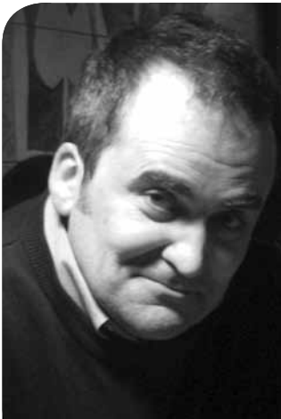
Piše: Zoran Jeremić

Ima jedna manje poznata a džojsovski snažna Uskokovićeva pripovetka s početka prošloga veka pod nazivom "Misli". Dobuje neka sitna biblijska kišica u Užicu, junak gleda kroz prozor, priseća se detinjstva... u kafani preko puta dokonise neki stari ćurčija Dragojlo,