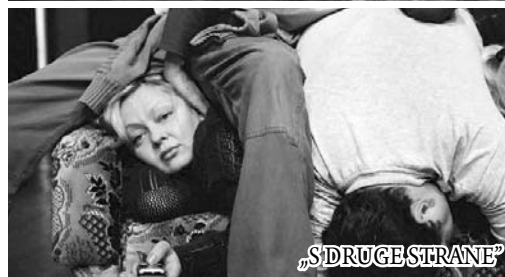
„S DRUGE STRANE“