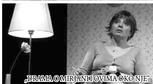
„DRAMA O MIRJANI I OVIMA OKO NJE“

društvenim i političkim tegobama, pa zaokruženo tematsko polje iz kojeg izviru ove izvedbe mogli bismo s malo ironije i puno sjete nazvati Izveštajem iz jeftinog života. Malo više humora toj tegobnoj slici daje predstava „Ribarske svađe“ ali zatamnjeni međuljudski odnosi centralna neuralgična su točka koja tišti kako suvremena društva tako i pozorište. Tom žarištu usmerene su predstave „Sumnja“ koja težište traume vidi u institucijskim hijerarhijama moći, odnosno, kao u predstavama „Drama o Mirjani“ i „S druge strane“ – u porodici i oko nje. Predstave „Buđenje proleća“ i „Zoran Đinđić“, preko politike, obra-