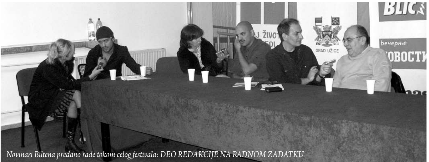
Novinari Biltena predano rade tokom celog festivala: DEO REDAKCIJE NA RADNOM ZADATKU